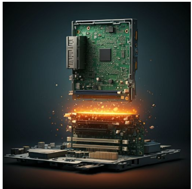
Billedet er genereret af AI